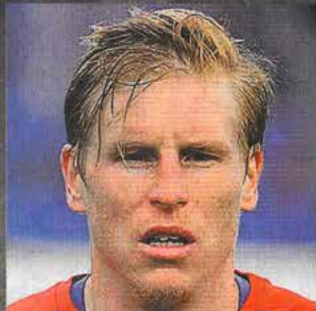
Před týdnem Českou republikou otřásla smutná zpráva o sebevraždě reprezentačního fotbalisty Františka Rajtorala (†31).

Rajtoral se oběsil ve svém domě v Turecku. Příčinou jeho činu měly být deprese, kterými fotbalista trpěl, a problémy v rodině.