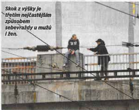
Skok z výšky je třetím nejčastějším způsobem sebevraždy u mužů i žen.

„Řekl bych to tak, že i psycholog může být dobrým vyjednávačem, ale rozhodně neplatí, že je jím au-