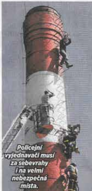
Policejní vyjednávači musí za sebevrahy i na velmi nebezpečná místa.